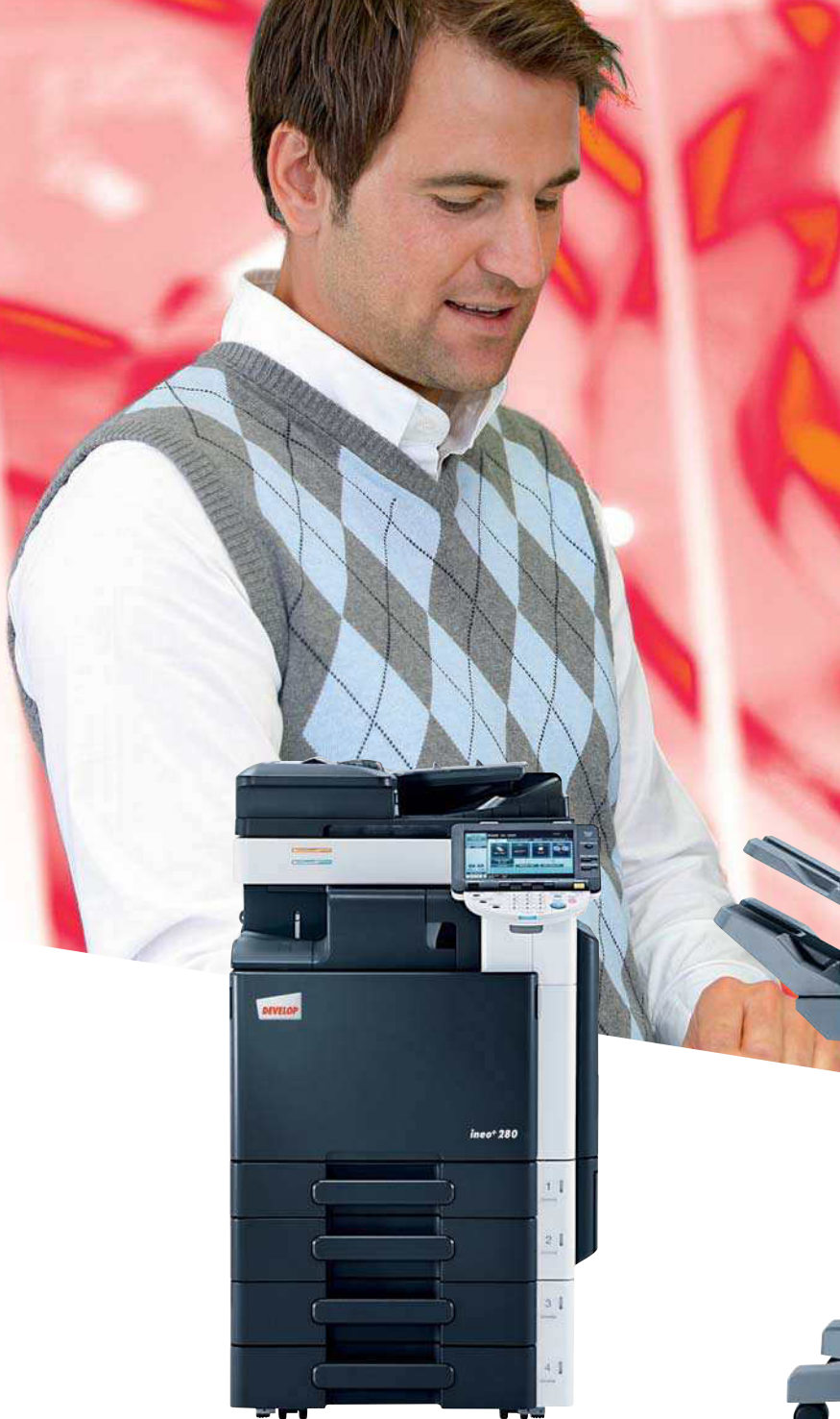
ineo+ 280 mit Origineleinzug (DF-617), Integriertem Finisher (FS-529) und 2 x 500 Blatt Papierkassette (PC-207)