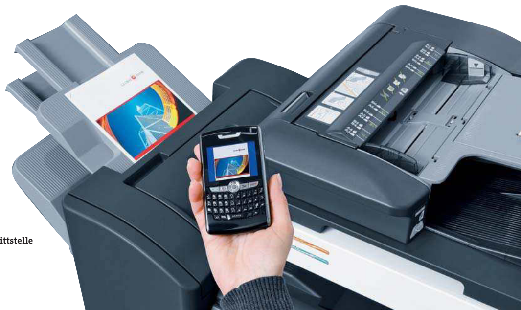
Mobiles Drucken über optionale Bluetooth-Schnittstelle