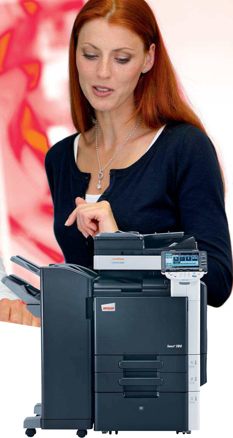
ineo+ 280 mit Origineleinzug (DF-617), Standfinisher (FS-527) und Großraumkassette(PC-408)